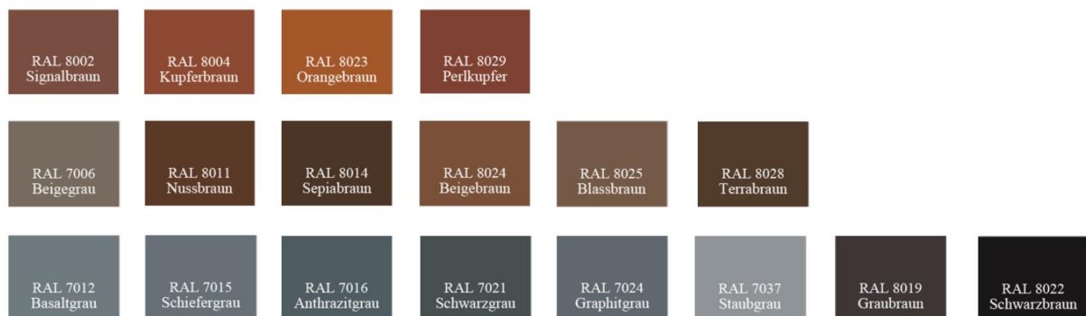
Darstellung festgesetzte RAL-Farben Classic

Grau: 7012, 7015, 7016, 7021, 7024, 7037, 7043, 8019, 8022